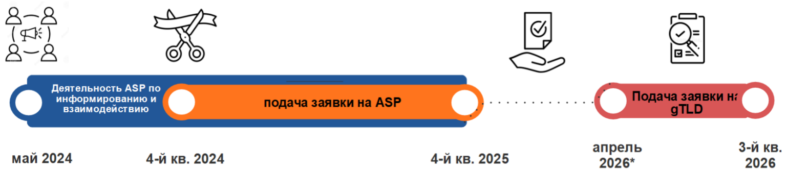
Рисунок 1. Общий график реализации программ ASP и New gTLD

*Прием заявок на новые gTLD предположительно начнется в апреле 2026 года и продлится 12–15 недель. Даты могут уточняться.