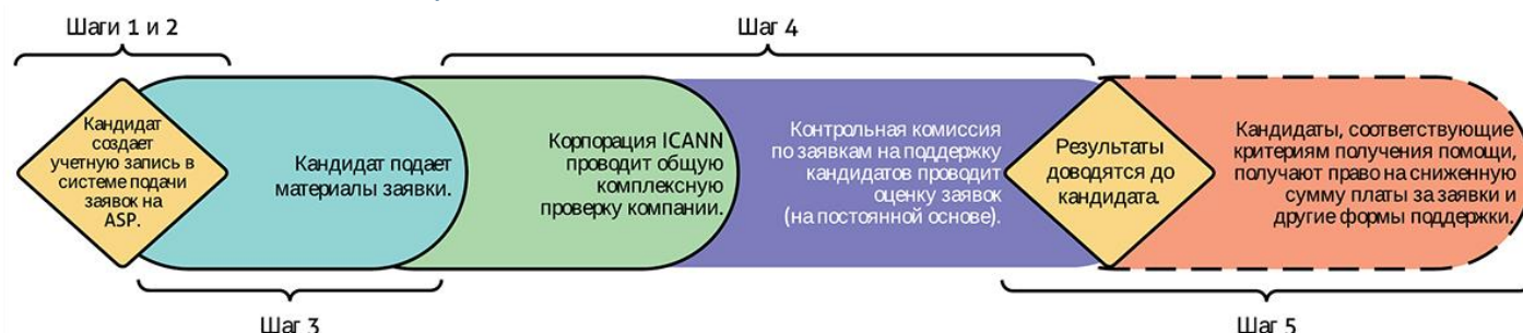
Рисунок 3. Последовательность подготовки, оценки и результатов Программы поддержки кандидатов

На приведенной ниже схеме представлен обзор поэтапного процесса подачи заявки на ASP с использованием системы подачи заявок на участие в ASP. В дополнение к этому обзору потенциальные кандидаты на участие в ASP получают доступ к руководству пользователя системы ASP.