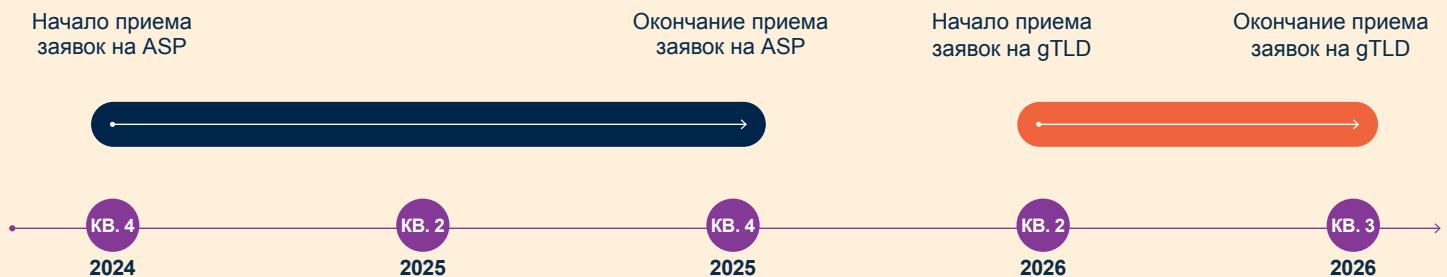
График программы ASP в рамках общего графика Программы по следующему раунду

Ожидается, что период приема заявок на новые gTLD начнется в апреле 2026 года и продлится 12–15 недель. ASP планируется запустить 19 ноября 2024 года; заявки по программе будут приниматься в течение 12 месяцев. Даты могут уточняться.